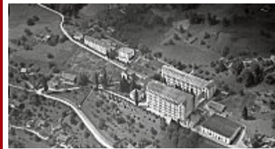
Alte Luftaufnahme der Fabrik.

1866 ist ein bedeutendes Jahr für die Gemeinde Mels, denn in diesem Jahr fasste der Glarner Industrielle Jakob Schuler den Entschluss, am Hang oberhalb von Mels eine Textilfabrik zu bauen. Der Standort war dabei wohl bedacht: Zum einen war dank der Hanglage günstige Wasserkraft zur Energiegewinnung vorhanden und zum anderen stand dank der armen Landbevölkerung ein grosses Reservoir an günstigen Arbeitskräften zur Verfügung. Die hohe Arbeitslosigkeit war schliesslich auch der Grund, weshalb die Melser sich in der Abstimmung vom 3. Februar 1867 für die Veräusserung des Grundstücks und somit den Bau der Fabrik entschieden. 1878 nahm die Fabrik dann mit 450 Webstühlen ihre Produktion auf. Anschliessend kam es zu mehreren Besitzerwechseln: 1920 übernahm der St. Galler Fabrikant Beat Stoffel die Firma, 1968 wurde sie von der amerikanischen Firma Burlington Industries übernommen und im Anschluss wurde sie an eine italienische Firma veräussert, die sie bis zur endgültigen Schliessung 1995 leitete.