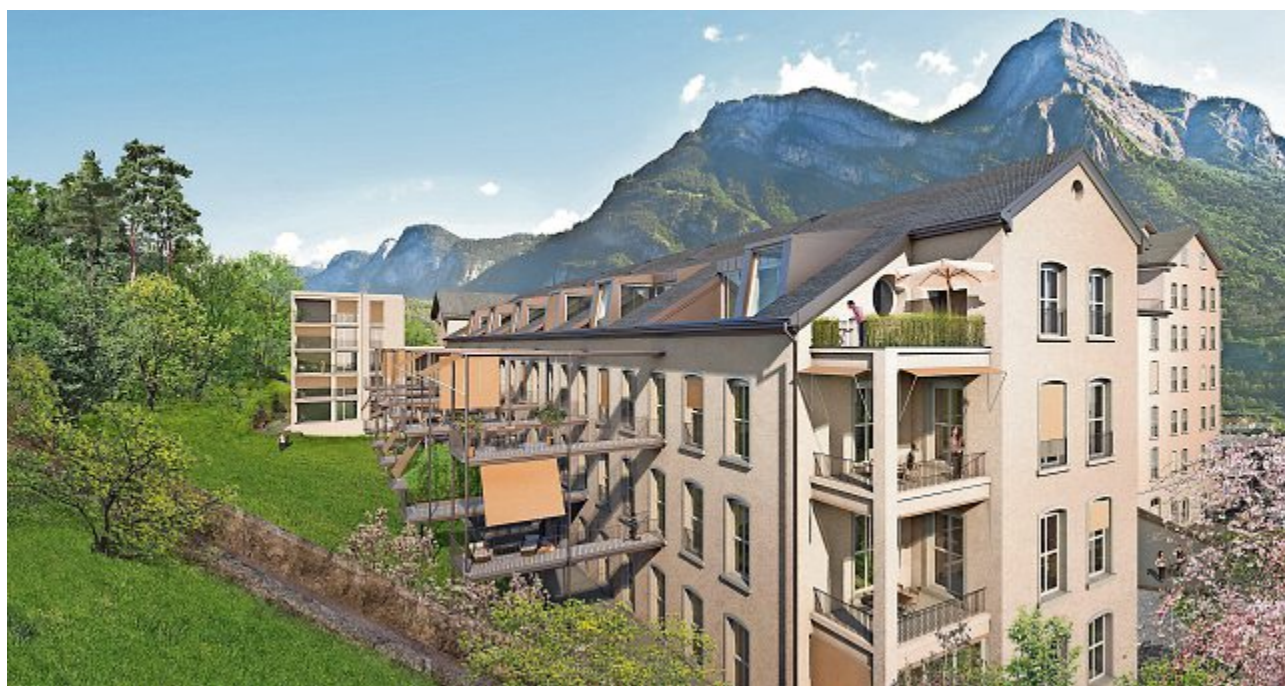
Visualisierung der sanierten Textilfabrik Mels.