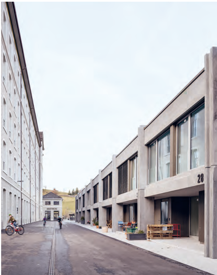
Die Spinnerei (links) und die «Town Houses» der Färberei säumen die Stoffelgasse.