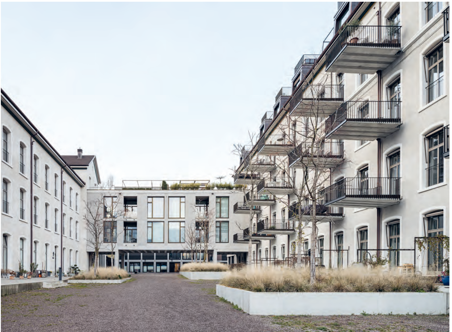
Zwischen der Weberei (links) und der Spinnerei weitet sich ein städtisch anmutender Raum. Die Balkone der Spinnerei sind zur Sonne hin ausgerichtet.