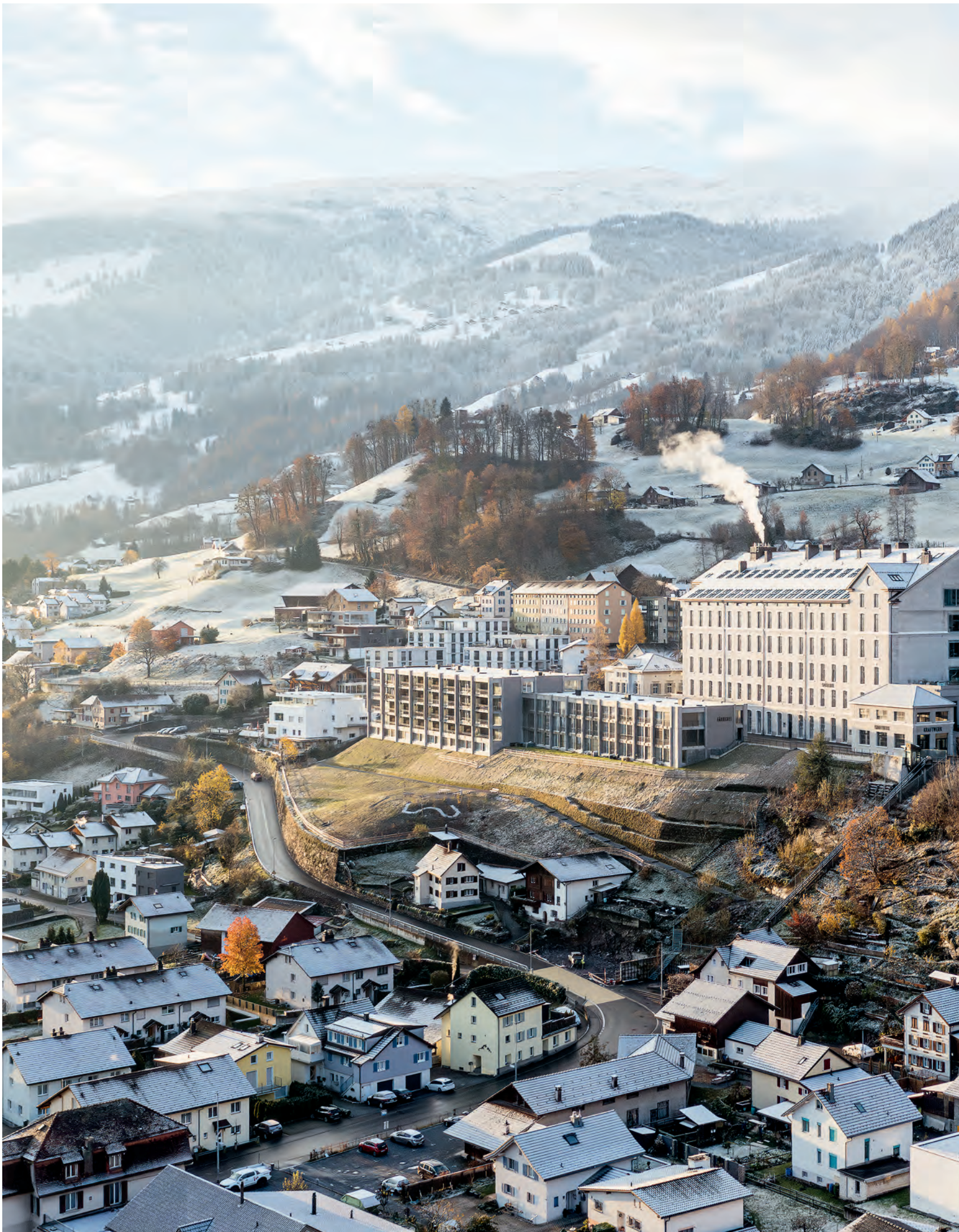
Stoffel Mels thront als eindrückliches Ensemble aus Alt und Neu über dem Dorf: Wo einst die Textilmaschinen ratterten, wird jetzt gewohnt.