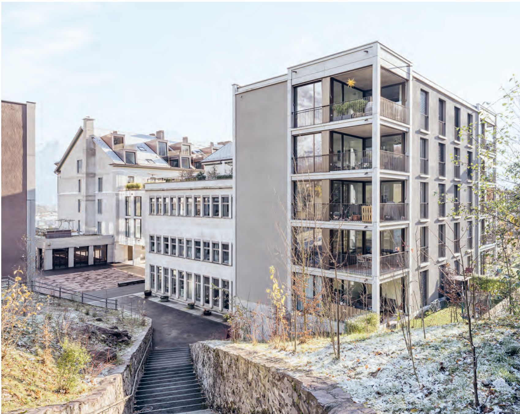
Blick von oben auf den Stoffelplatz – das Herz des Ensembles.