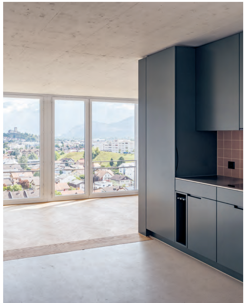
Von den «Town Houses» genießt man den Ausblick über das Dorf.

→ sogar 28 Meter. Ohne die lichte Raumhöhe von 3,7 Metern wäre das undenkbar. So jedoch stimmt das Verhältnis zwischen der Fläche und der Höhe, sodass man sich schnell an diese Dimensionen gewöhnt.