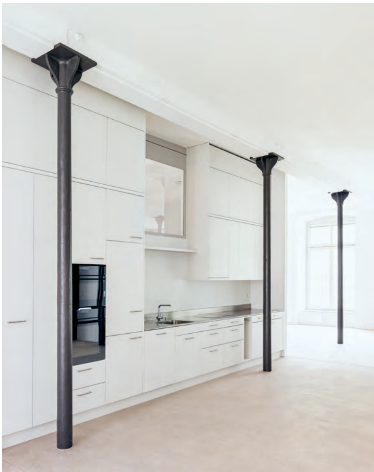
Die historischen Stützen der Fabrik rhythmisieren die Loftwohnungen.