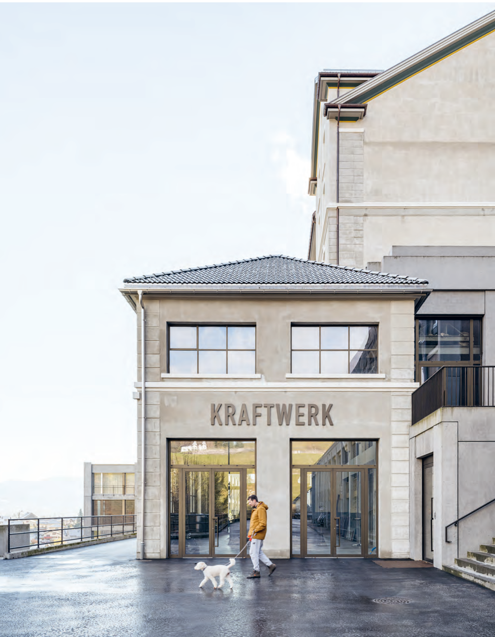
Ins ehemalige Kraftwerk wird noch ein Restaurant eingebaut. Links geht der Blick über Mels und das Tal, rechts führt die Treppe hoch zum Stoffelplatz.